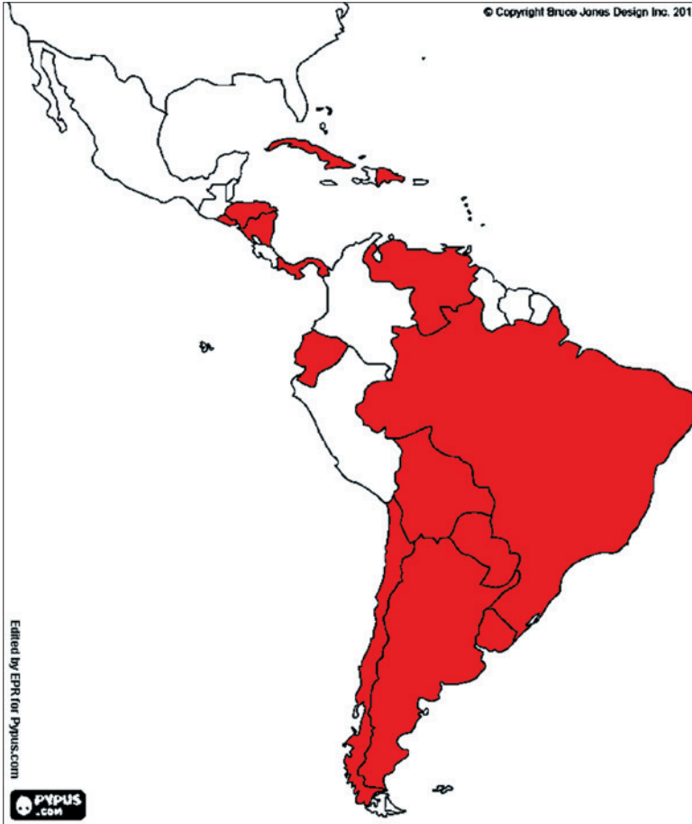
Figura 2 Países latinoamericanos donde gobernaban partidos miembros del Foro de São Paulo en 2009