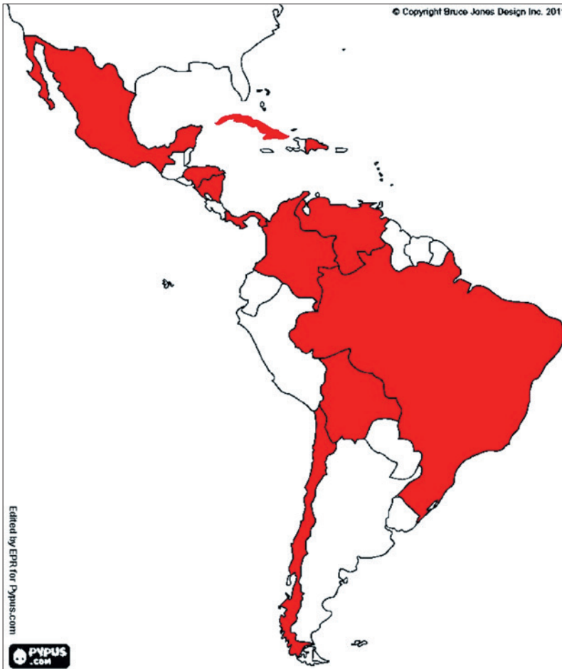
Figura 3 Países latinoamericanos donde gobernaban partidos miembros del Foro de São Paulo en agosto de 2024