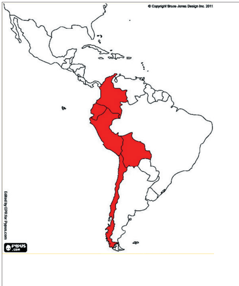
Figura 4 Países de Iberoamérica donde sucedieron graves conflictos entre 2019-2023